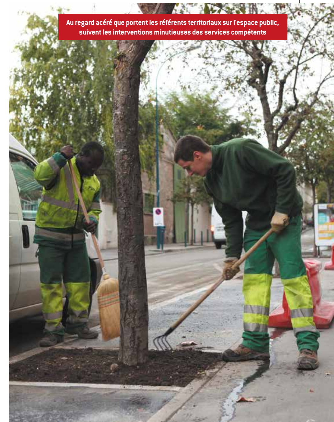
Au regard acéré que portent les référents territoriaux sur l'espace public, suivent les interventions minutieuses des services compétents

26 juin, 14.30, au centre administratif. Sec-teur du jour : les Quatre-Chemins. Autour de la table : la directrice des espaces publics, le chef du pôle Territorialisation, le surveillant des travaux de voirie et le RTS