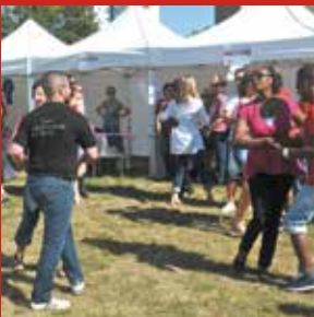
Photo prise au centre commercial Verpantin dans le cadre de l'Inventaire dansé de la ville de Pantin.