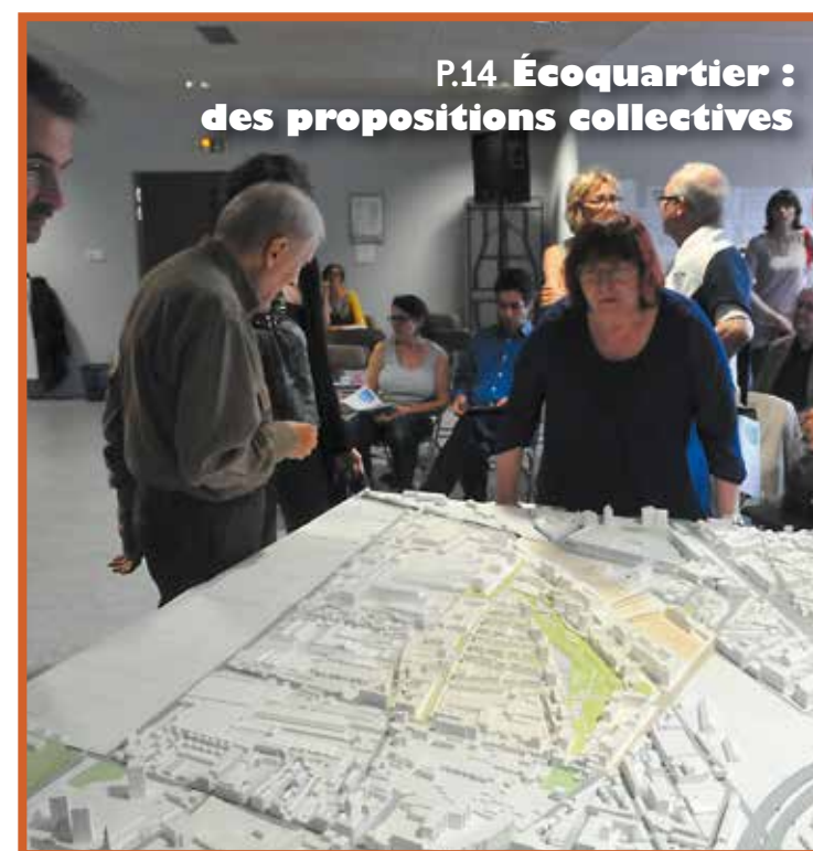
P.14 Écoquartier : des propositions collectives