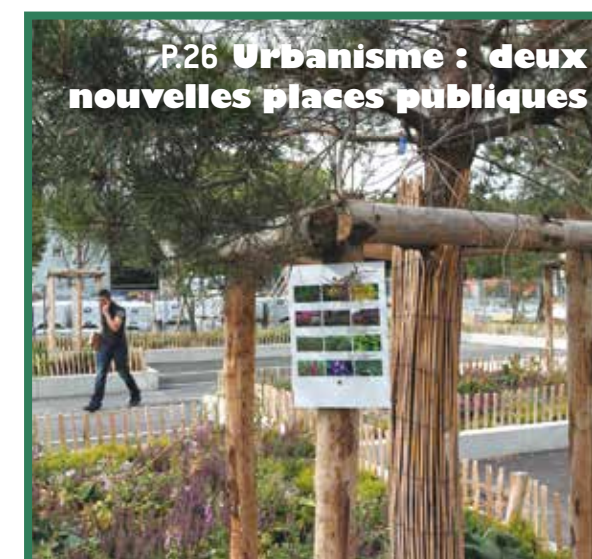
P.26 Urbanisme : deux nouvelles places publiques