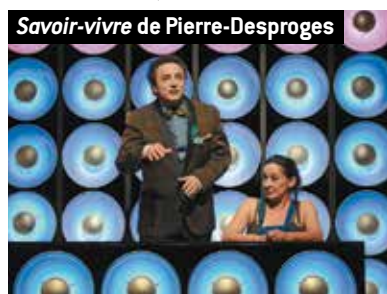
Savoir-vivre de Pierre-Desproges

Côté musique, Pantin résonnera ainsi de tous les sons, de toutes les couleurs : le rap d'orfèvre d'Oxmo Puccino (9 octobre), la soul épiciée d'Alice Russell (14 novembre), la chanson poétique d'Alexis HK (21 mars), l'alchimie vocale du scatteur et batteur André Minvielle (23 mars) ou encore la relecture moderne, et ô combien vivifiante, de La Flûte enchantée de Mozart par le génial Peter Brook (3 décembre). Africolor, partenaire de longue date, propose Fangnawa (20 décembre), soit une création en forme de fusion géographique : la rencontre haute en groove entre le groupe d'afrobeat montpelliérain Fanga et des Gnawas marocains, ces descendants d'esclaves d'Afrique noire, qui guérissent les corps et les esprits en musique par leurs cérémonies de transe. Deux noms, deux temps forts, marquent, quant à eux, la saison classique, exposée par Étienne Vandier, directeur du conservatoire : deux soirées, consacrées respectivement aux œuvres de Poulenc (13 novembre), dont l'on célèbre le 50 e anniversaire de la mort, et de