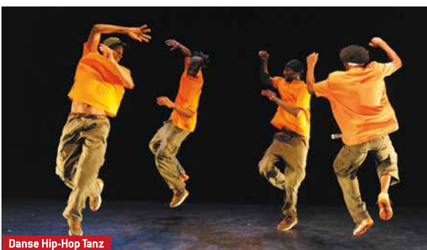
Danse Hip-Hop Tanz