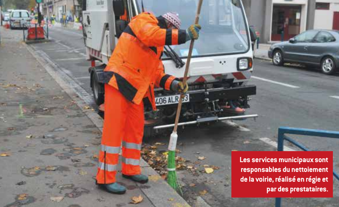
Les services municipaux sont responsables du nettoyage de la voirie, réalisé en régie et par des prestataires.

échéant, de verbaliser les contrevenants, est en cours de constitution.